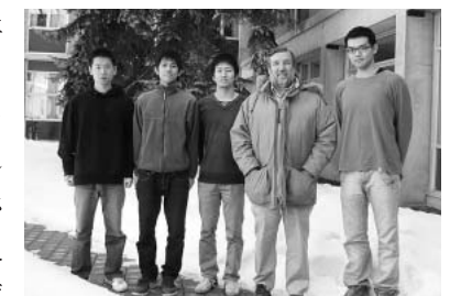
先方の受け入れ教員と、今年度の交換留学生(京大、東工大)ウォーターラー大学工学部システムデザイン工学科の前にて

ひとつひとつの出来事について言えば、失敗、失敗、また失敗という日々でしたが、行って初めてわかったこともたくさんありました。留学を考えている方には、とりあえず行ってみることをお勧めします。