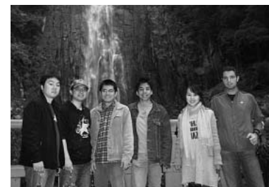
In front of Nachi Falls

Although not willing to, we finished our trip and got back to Kyoto in the late afternoon. I sincerely appreciate the efforts of the engineering department in organizing this meaningful trip for international students. During the two days, I've experienced Japanese culture through famous scenery we've visited. This trip also provided me a good opportunity to make international friends. Two days was not long, but we all shared plenty of valuable time together. I truly hope next year more international students will be able to attend this trip and have wonderful experience just as I had this time.