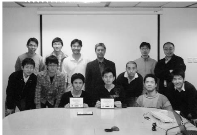
写真1: 2007年12月8日に香港科学技術大学で行った国際連携講義の課題評価授業後の集合写真

(1) http://www.marubeni-sys.com/infinite-ideas/chousen/kyoto3/