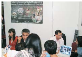
アジア人財プログラムブースの様子 (ジャカルタ会場)

おわりに、今回の留学フェア 参加がアジア人財プログラムの 広報のみならず京都大学が取 り組んでいる国際化の一助に なることを祈念して項を終えます。