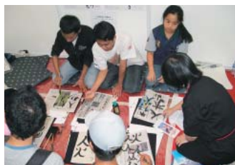
日本文化紹介のシーン (ジャカルタ会場)