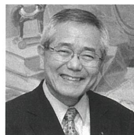
米パデュー大学 根岸 英一特別教授 (帝人グループ名誉フェロー) 帝人久村奨学生第5回生(1957年)

そして自らの「夢」を見つけたら真理を突き詰めるまで、とことんチャレンジしてください。今後の皆さんの大いなる活躍に期待しています。