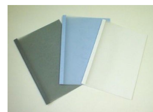
簡易製本ファイル(例)

生協ショップで簡易製本ファイルを購入すると、店内で製本加工できます。 → 本申請の提出のときのみ受理します。ただし、穴をあけて綴るファイルは不可 簡易製本で背表紙を入れるのが難しい場合は、手書きで氏名を記入しておいて下さい。