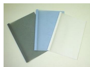
簡易製本ファイル(例)

If you buy the easy bookbinding file at coop shop, you can binding by yourself →